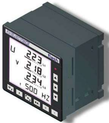
96 x 96 DIN