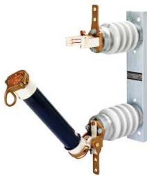
EKO-3D Open Position