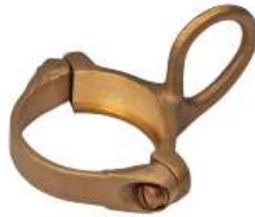
EK-3D and DD 9F61AAW612